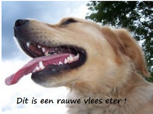
Dit is een rauwe vlees eter !